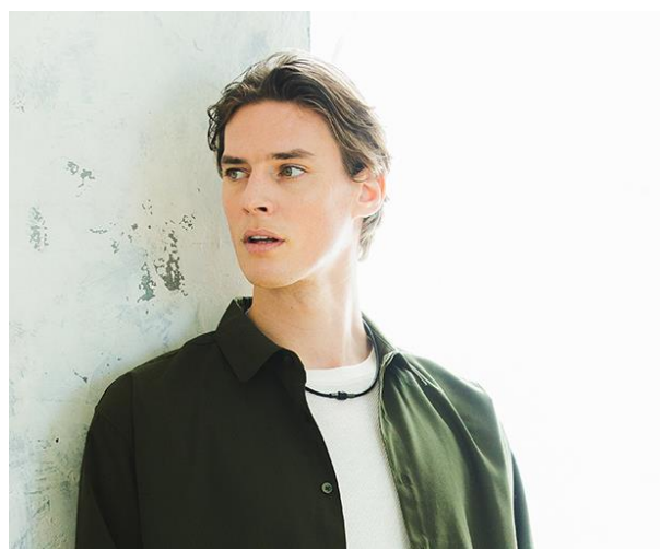
着用イメージ<プレミアムブラック>