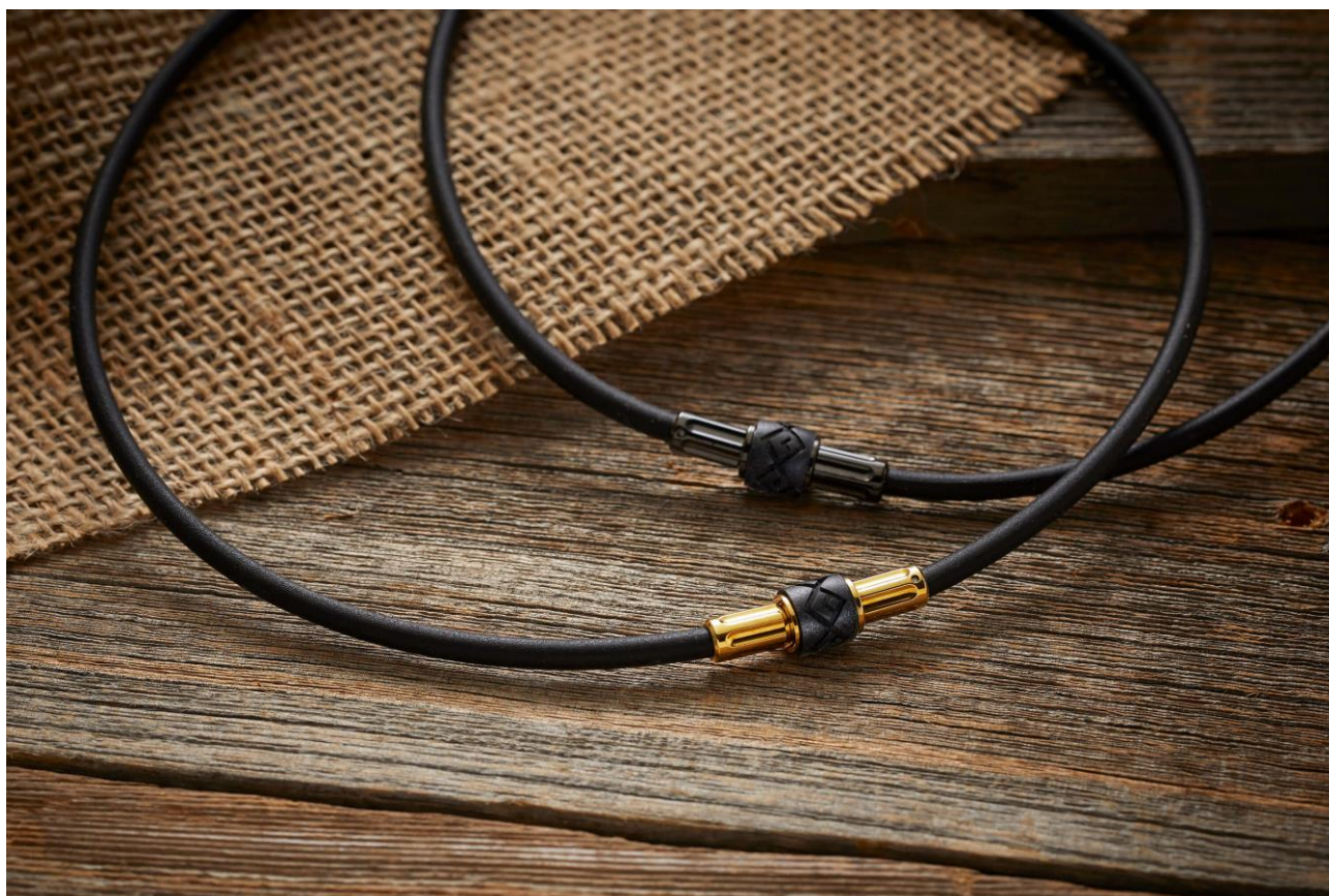
コラントツテ ネックレス Revol 価格¥9,900/税込 写真上<プレミアムブラック>写真下<プレミアムゴールド>

磁気健康ギア「Colantotte（コラントツテ）」の製造・販売元である株式会社コラントツテ（本社：大阪市中央区、代表取締役社長：小松 克己）は、肌当たりが柔らかな軽い着け心地のシリコンネックレス「コラントツテ ネックレス Revol（リボル）」（価格¥9,900/税込）を2021年5月19日よりコラントツテオフィシャルサイト、オフィシャルショップ及び一部WEBショップで販売いたします。