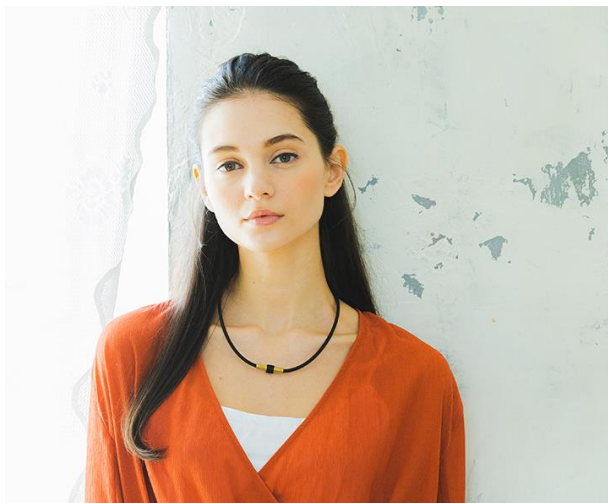
着用イメージ<プレミアムゴールド>