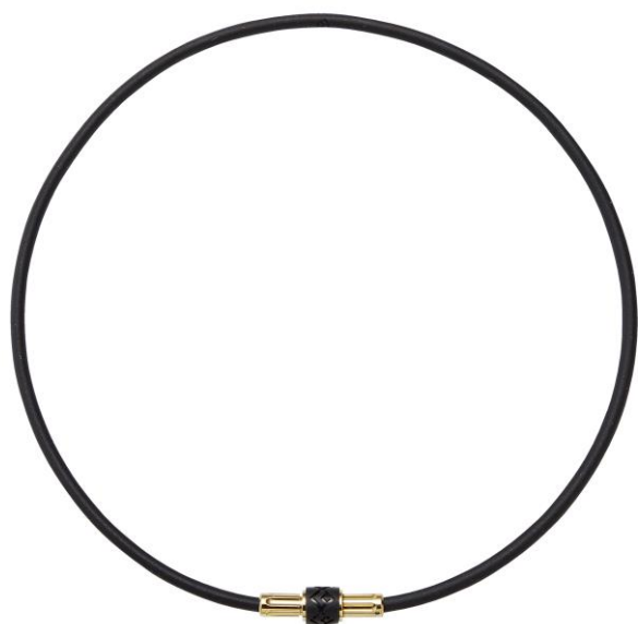
プレミアムゴールド