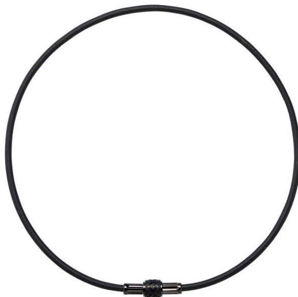
プレミアムブラック