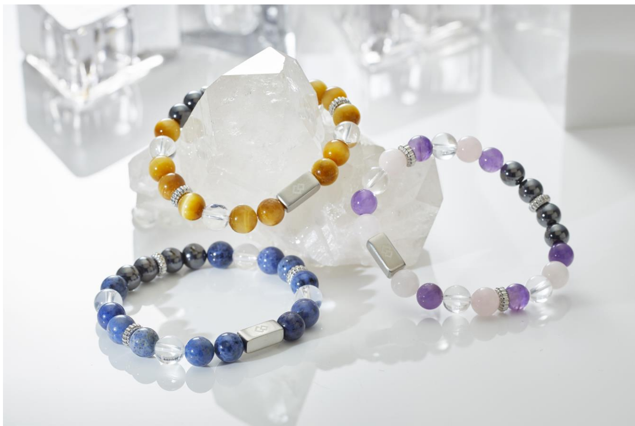
コラントツテ ループ EN-tsubomi 価格¥8,580/税込

磁気健康ギア「Colantotte（コラントツテ）」の製造・販売元である株式会社コラントツテ（本社：大阪府中央区、代表取締役社長：小松 克己）は、数珠タイプの腕用磁気アクセサリ「コラントツテ ループ EN」から天然石のサイズが小粒になったモデル「コラントツテ ループ EN-tsubomi（エン ツボミ）」（価格¥8,580/税込）を2021年4月28日よりコラントツテ公式サイト、公式サイトで販売いたします。