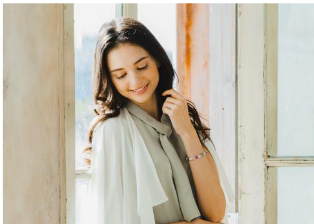
着用イメージ<ローズクォーツ×アメジスト×水晶>