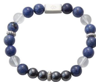
デュモルチェライト×水晶