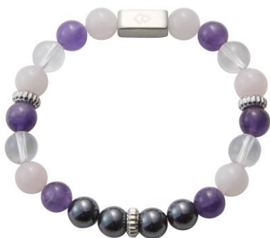
ローズクォーツ×アメジスト×水晶