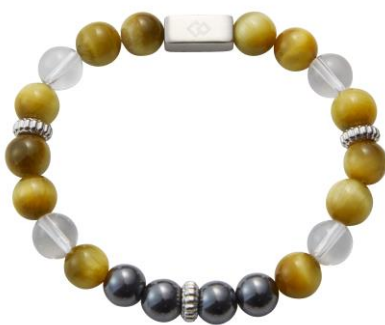
ゴールドンタイガーアイ×水晶