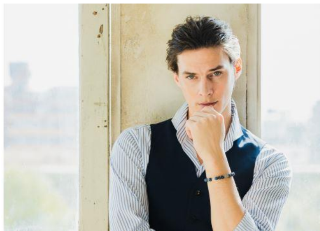
着用イメージ<デュモルチェライト×水晶>