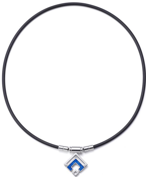
シルバー×ブルーラメ

■ペンダントトップは「鏡面加工」と「研ぎ出し七宝」の技術で美しいコントラストを演出。樹脂にラメを施し高級感の中に華やかさが加わりました。全て人の手で1点ずつ加工を施し丁寧に仕上げられています。