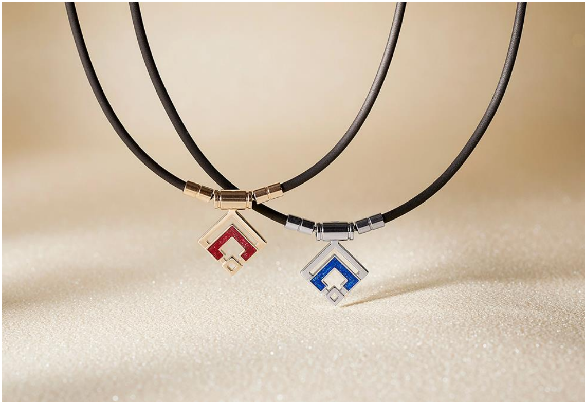
コラントツテ TAO ネックレス スリム ARAN mini