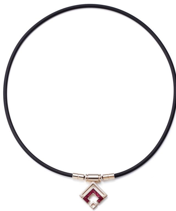
シャンパンゴールド×ルビーレッドラメ