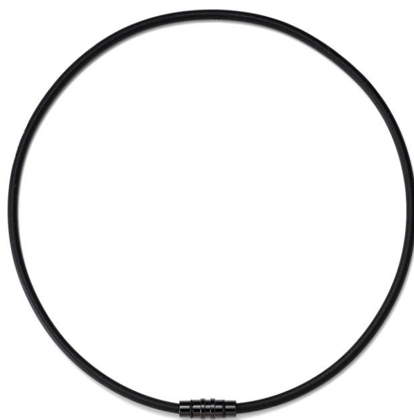
ブラック×ブラック