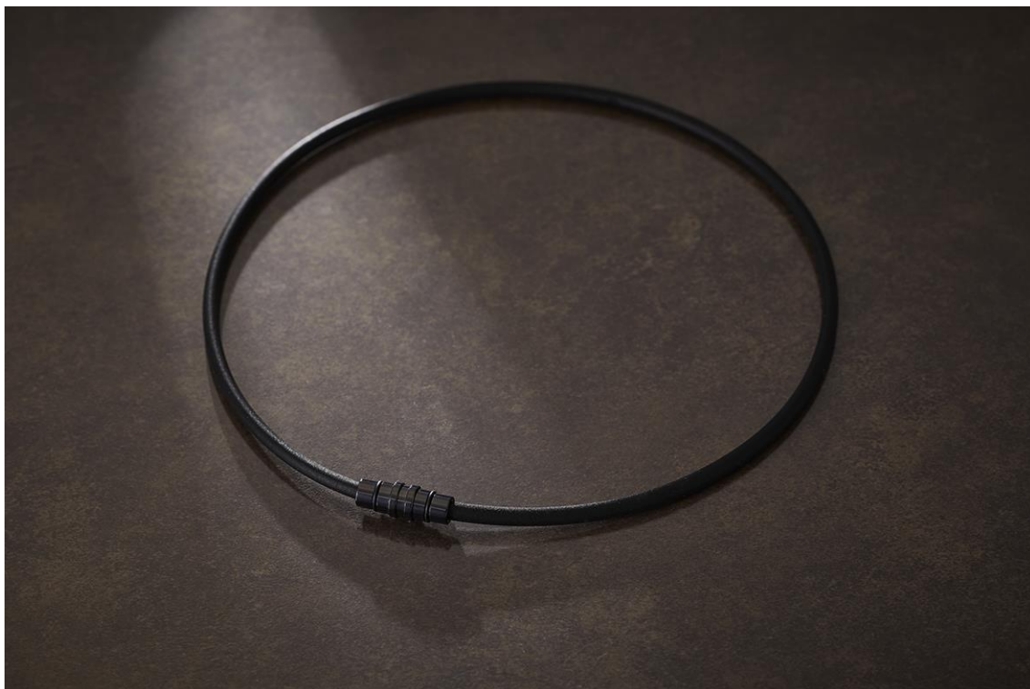
コラントッテ ネックレス クレスト SMART<ブラック×ブラック/夢・八天限定カラー>

ビジネスシーンからスポーツシーンまで幅広く活躍するシンプルなデザイン。ネックレス クレストのトップジョイントをコンパクトに、ループ幅は5mmから4mmへと細くしたことで、より軽い着け心地を実現しました。ジョイントは錆びにくい高品位なステンレスを採用しており、マグネットタイプで取り外しも簡単です。シリコンループには独自のN極S極交互配列で磁石を配置。ファッションアイテムとして身につけながら、磁気のカで血行改善を促し肩のコリを緩和することができます。カラーは「プレミアムシルバー」と「プレミアムブラック」、コラントッテオフィシャルサイト・オフィシャルショップ限定カラーの「ピンクゴールド」、夢・八天限定カラーの「ブラック×ブラック」の4色展開です。