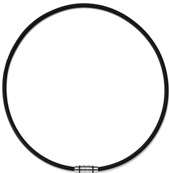
プレミアムシルバー