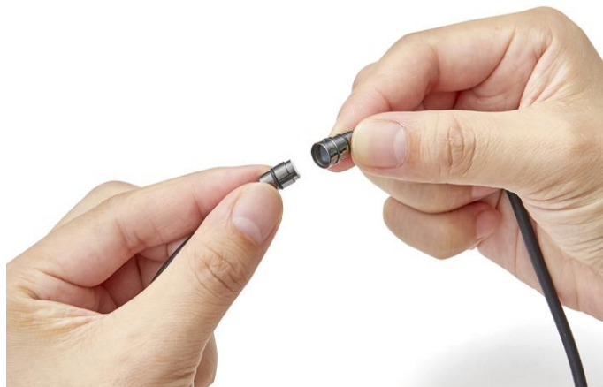
簡単に取り外しできるマグネットタイプのジョイント