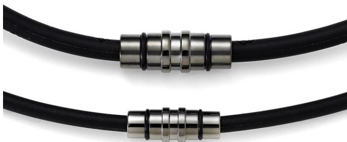
ネックレス クレストとの比較