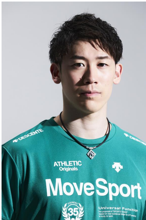
コラントツテ TAO ネックレス α ARAN を愛用

コラントツテ初のバレーボール選手との契約であり、石川祐希選手と共にチャレンジし、これからも全力で応援・サポートしてまいります。