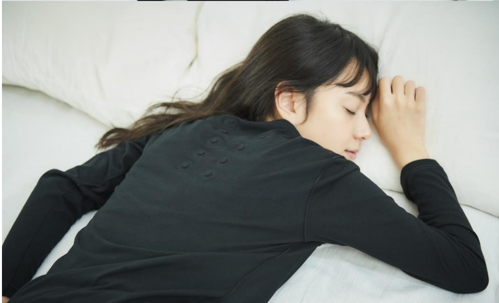
コラントツテ レスノ MAGNE リカバリーシャツ ロング（価格¥8,250/税込）