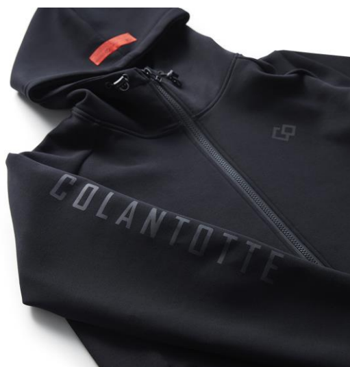
右袖のコラントッテロゴ