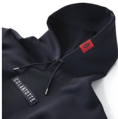
フードのコラントットロゴマーク