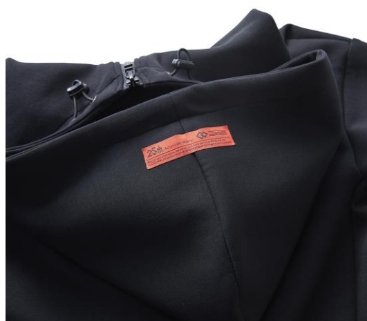
フードの25周年記念タグ