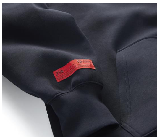
右袖の25周年記念タグ