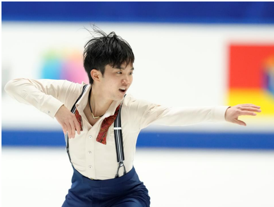
コラントッテ TAO ネックレス α VEGA NEXT を愛用