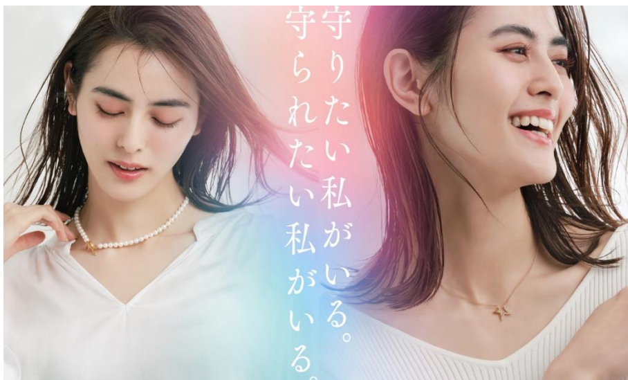
モデル着用写真（左）は2024年6月発売予定

多忙でケアが大事になってくるものの、なかなか時間が割けない現代の女性。そんな女性を一人でも多く笑顔にすることで、家族や社会も笑顔にしたいという考えの下、ブランド『Lierrey』は誕生しました。