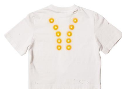
MAGNETIC STRIPE SHIRT