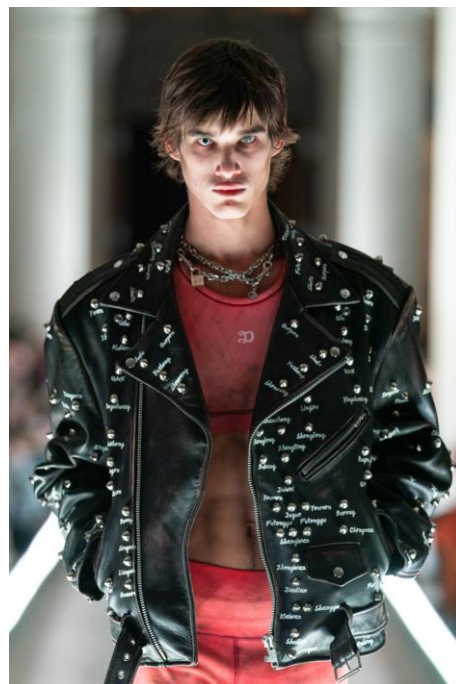
MAGNETIC CHAIN NECKLACE 価格：¥30,800/税込