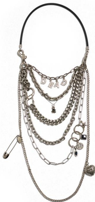
MAGNETIC "DEAD" NECKLACE 価格：¥49,500/税込