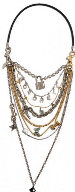
MAGNETIC "GO TO HELL" NECKLACE 価格：¥49,500/税