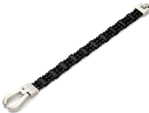
170 ミリテスラと 100 ミリテスラの磁石の組み合わせ