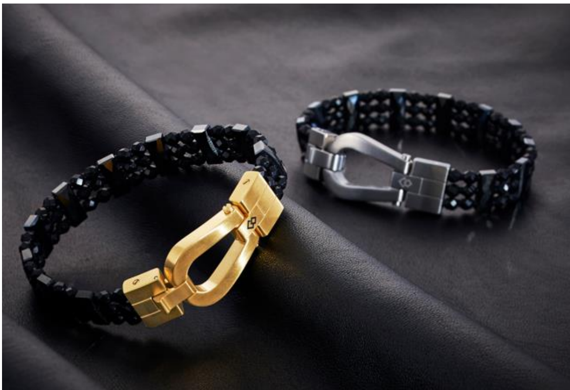
「コラントツテ THEO ループ CARO」価格 ¥46,200/税込