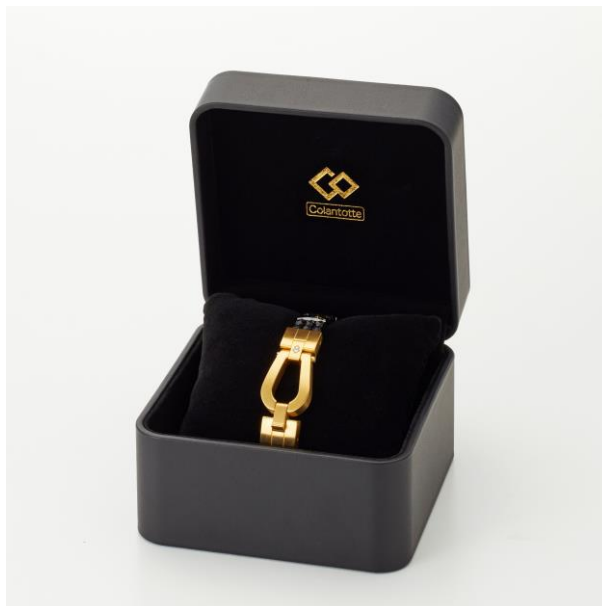
収納できるオールブラックのジュエリーボックス付き