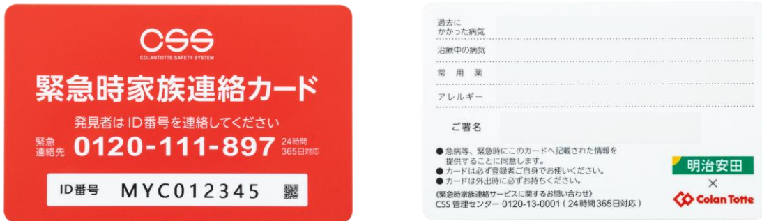
緊急時家族連絡カード（サンプル）