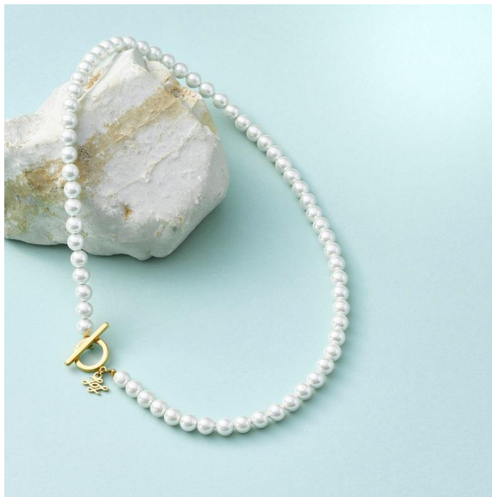
Lierrey パールネックレス (38,500円/税込)