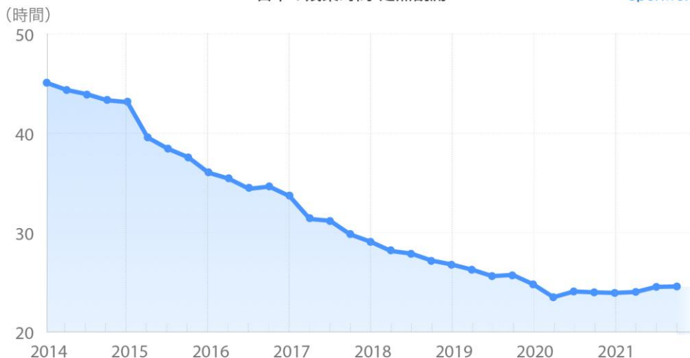
業種別残業時間 定点観測