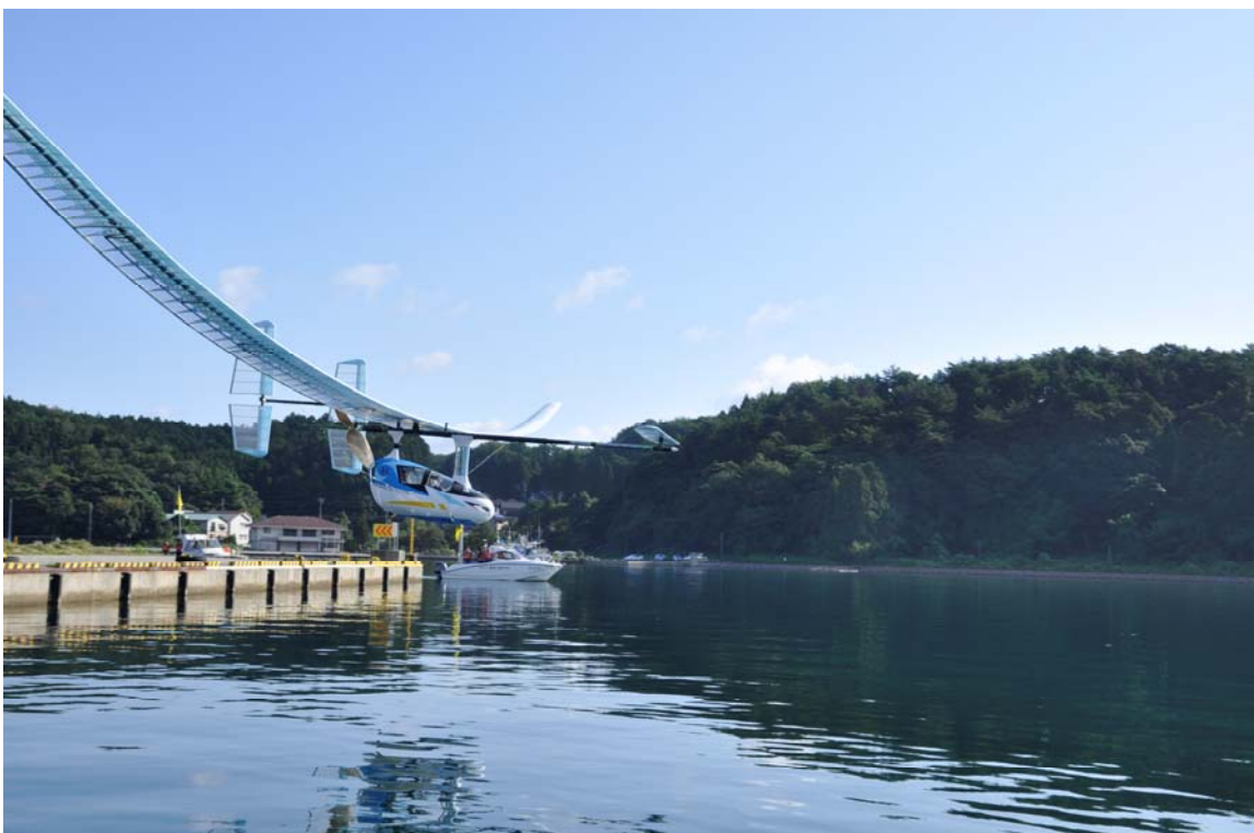
平成 29 年 9 月に初めて穴水湾飛行に挑戦した「航」(読み:わたる)。535m 飛行した。