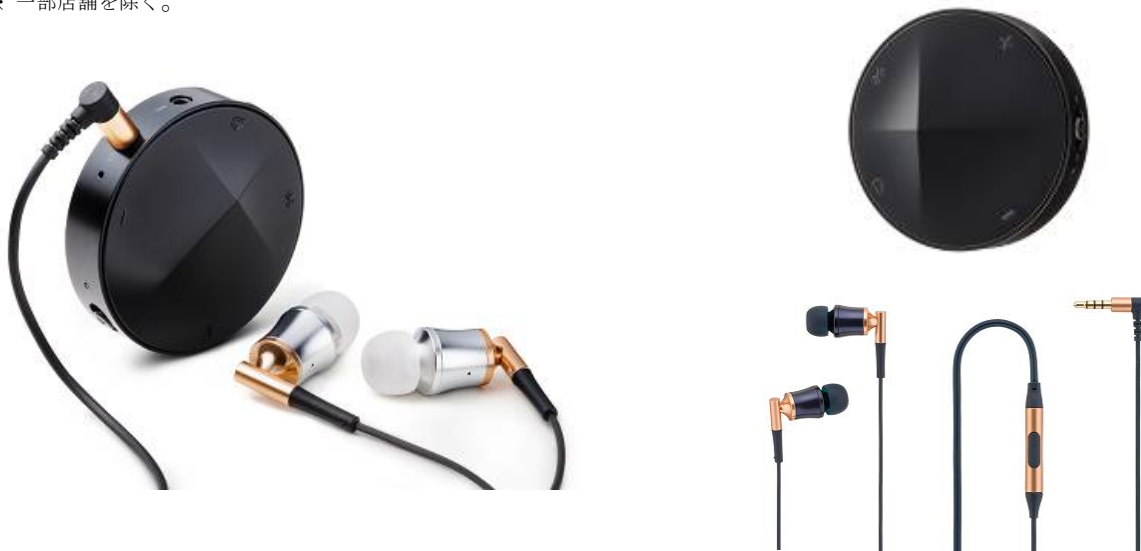
<製品ラインアップ>