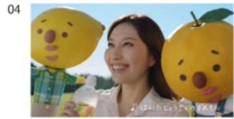
ゆずさんとれもんくん) 甘すぎなくて