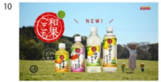
ゆずさんとれもんくん) ゆずれもん はいださん) 新発売!