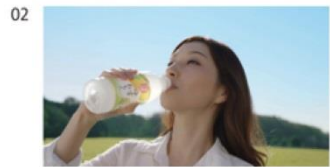
はいださん) ゴクッ