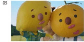
ゆずさんとれもんくん) ちょうどいい～