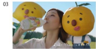
ゆずさん) ♪旬のゆずと～ れもんくん) ♪旬のレモン～