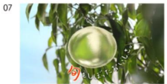
はいださん) 旬をしぼった