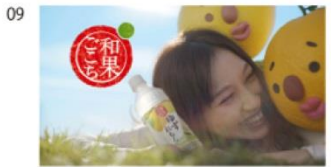
はいださん) ♪和果ごこち