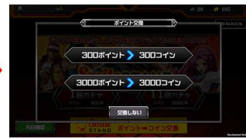
希望する交換比率をタップ