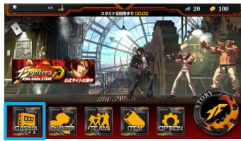
水色枠内をタップ