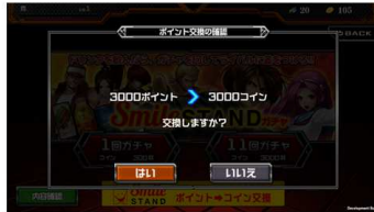
内容を確認し「はい」をタップ