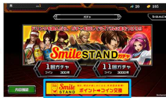
水色枠内をタップ