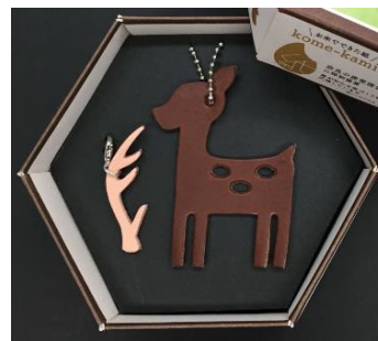
③「バンビレザチャーム」