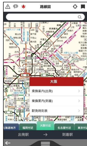
< 図2：路線図画面 >