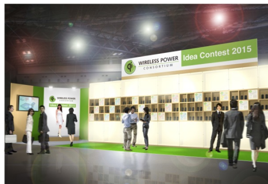
イメージ：CEATEC2015 での表彰式/作品展示