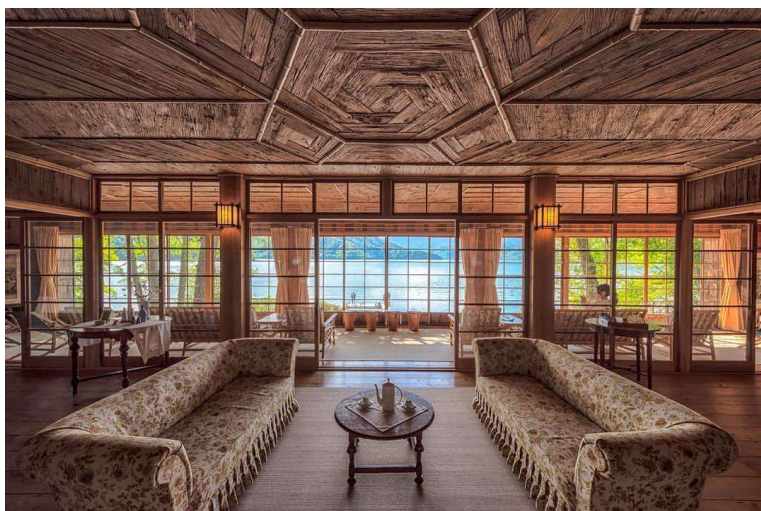
イタリア大使館別荘記念公園は4月に改修工事が完了

「令和元年」を記念したスペシャルイベント、スーパーGW情報、 新たなインバウンド拠点、お店も続々オープン話題盛りだくさん日光へ