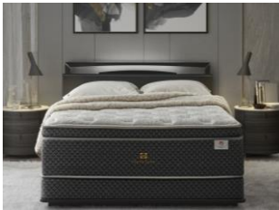
クラウンジュエル (L195cm)

ガーナイトIV Gahnite4 最も上質な眠りを追求し シーリーの技術を詰め込んだ コレクション最上位のマットレス