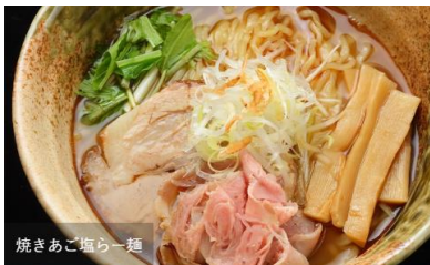
焼きあご塩らー麺