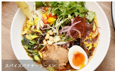
スパイスバクチーラーメン

国産豚の拳骨を丁寧に時間をかけて炊いたまろやかな豚骨スープに、焼きアゴ（トビウオ）などの魚介出汁を加えたスープが自慢のラーメン店