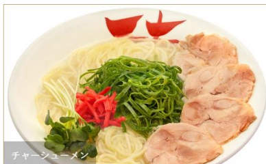
チャーシューメン

鶏ガラベースに昆布やホタテの旨味をたっぷりと効かせた絶妙な“コクとキレ”を追求したこだわりの黄金スープが特徴