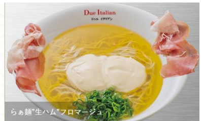
らぁ麺*生ハム*フロマージュ

器の上に散りばめられた華やかで艶やかな野菜たち。スパイスの芳醇な香りが鼻腔を刺激する濃厚で旨味たっぷりのスープとスパイスラーメン。