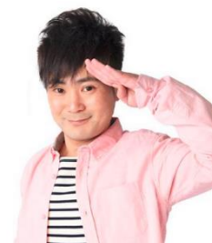
相席屋公式イメージキャラクター

今までにない新しいスタイルで雑誌や新聞、Web メディア、また多くのテレビ番組に取材をいただいております。