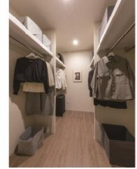
Walk in closet