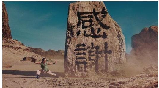
伝説の武闘家ジャッキー・チェン 扇篇 https://youtu.be/WcPdQVCGAMQ