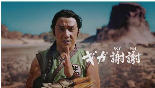
伝説の武闘家ジャッキー・チェン 登場篇 https://youtu.be/JPr6uP-auN8

踏ん張りすぎて破れたスポンからスライム柄のパンツが見えたり、間違えて素手で岩を叩いてしまい痛がったりと、カッコよく決めるアクションの中にコミカルな動きを織り交ぜたストーリー展開も見どころのひとつで、ジャッキー・チェンさんのシリアス&お茶目なキャラクターを最大に引き出しながら、短い時間の中でジャッキー映画作品に通じる世界観を再現しています。