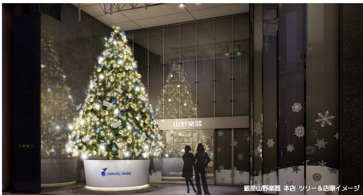
銀座山野楽器 本店 ツリー&店頭イメージ