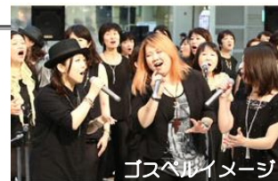
ゴスペルイメージ