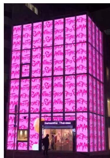
サマンサタバサ 表参道 GATES ポップアップ デジタルストア

Instagram: https://www.instagram.com/samantha.thavasa.info/?hl=ja