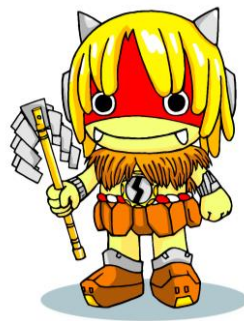
秋田県PRキャラクター