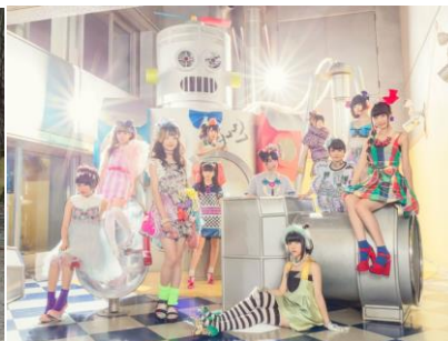
虹のコンキスタドール