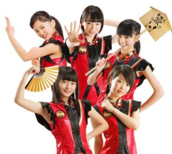
水戸ご当地アイドル(仮)