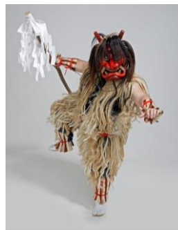
なまはげ練り歩き【写真可】