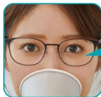
くもりにくいレンズ ※使用環境や状況によって 曇ることがあります。