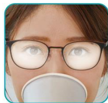
曇るレンズ ※通常レンズ (VPコートレンズ)

また、レンズ両面に「吸水層」を持つ特殊なコーティングを施す技術により優れた曇り低減性能を発揮。通常レンズ（弊社 VP コート）と比較すると、約 3 倍くもりにくい結果となりました。（社内調査：40 度の蒸気試験）