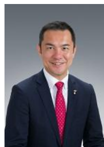
三重県知事 鈴木英敬

第4回は2010年のマドリッド・フュージョン(世界最高峰の料理学会)で「世界で最も影響力のあるシェフ」、2015年には「世界のベストレストラン50」で第8位に選ばれるなど、世界中から注目されている東京・南青山「NARISAWA」のオーナーシェフ、成澤 由浩さんをゲストにお招きし、これまで成澤さんが取り組まれてきた自然保護に関わる料理について語っていただくほか、三重県にお越しいただいた際に受けた三重の印象や食材などについてお話しいただきます。