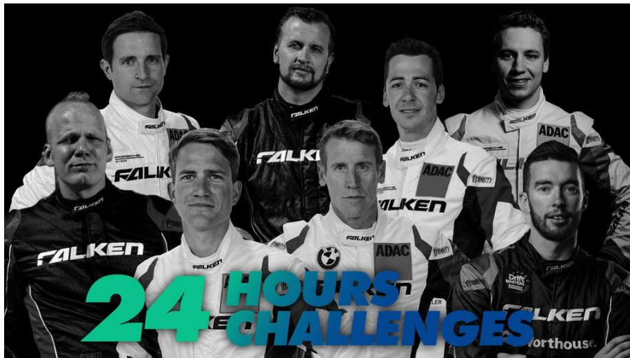
24 時間・24 チャレンジ動画「#24in24」