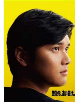
大谷翔平 1994年7月5日生まれ(年齢30歳) 岩手県奥州市出身