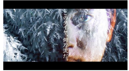
晴・雨・雪・氷を表現した映像が大谷選手に投影される