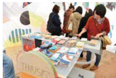
▲学生の作品を購入することができる雑貨店やフリーマーケット、作品販売もあります。