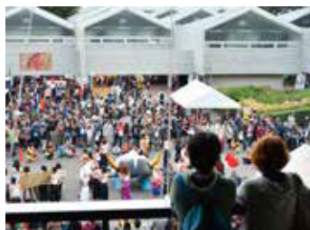
▲構内の至る所でさまざまなイベントが催されます。美術大学ならではの工夫が施されたイベントが目白押しです。