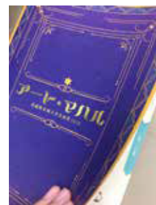
▲芸祭パンフレット。表紙の箔押しがポイントです。