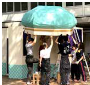
▲芸術祭のシンボルとなる総合案内所の制作風景。試行錯誤しながら制作されました。