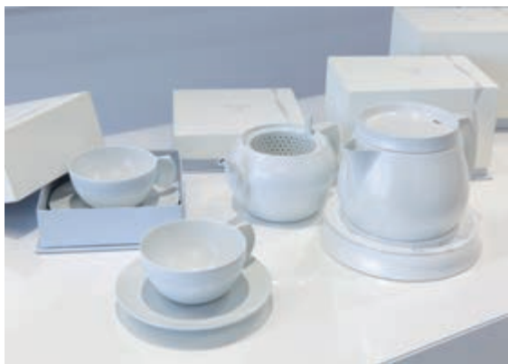
工芸工業デザイン学科 松崎 玲奈 《Stream》