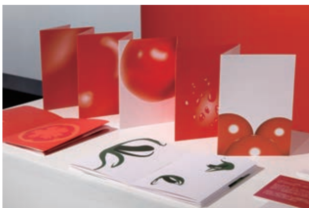
基礎デザイン学科 笹原 早希子 《tomato》