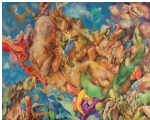
油絵学科 [油絵専攻] 川鍋 理沙 《nada》