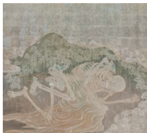
日本画コース チョウ アンテキ 《goodnight in the raining night》