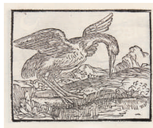
図録5. Emblematum libellus (部分) 1546年