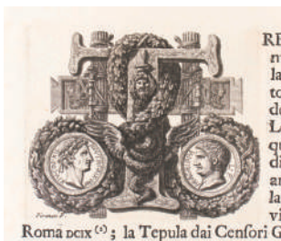
図版4. Le Rovine del Castello dell' Acqua Giulia (部分) 1764年