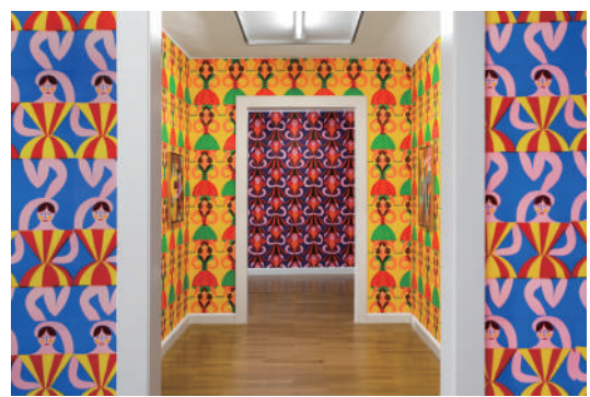
図版 13. クリストフ・ルックヘバーレ 個展「Volkskunst Fabrik」展示風景 (Städtische Galerie Delmenhorst / ドイツ, 2017年)