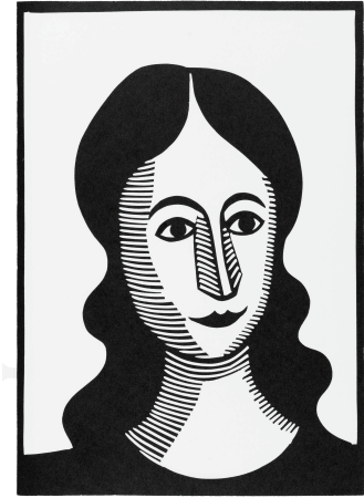
図版3. Lubok 11 (部分) 2013年