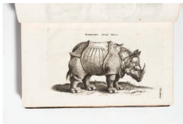
図版 8. Historiae naturalis de quadrupedibus 1657年