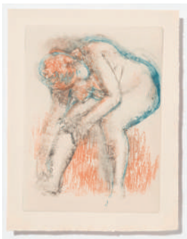
図版 9. Degas, danse, dessin 1936年