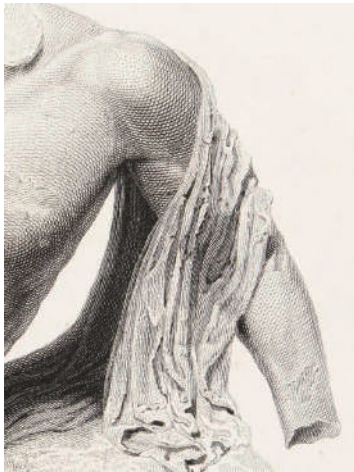
図版1. A description of the collection of ancient marbles in the British Museum (部分) 1818年

ART-BOOK: Pictoriality in Print Rare Books of MAU M&L×Lubok