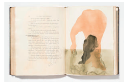
図録6. Les jardin des supplices 1902年