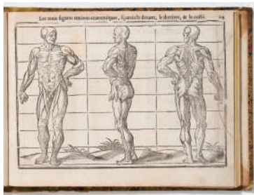
図版 7. Livre de pourtraicture 1656年