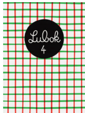
図版 12. Lubok 4 (表紙) 2007年