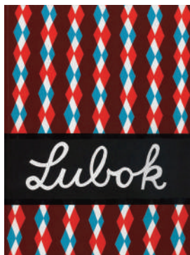
図版 11. Lubok 1 (表紙) 2007年

ドイツ人アーティスト、クリストフ・ルックヘバーレが主宰する出版社。ライプツィヒを拠点に2007年に創設。Lubokとはロシアの民衆版画、Verlagはドイツ語で出版社を意味する。彼らで作るアートブックは、リノカットの版画そのものが束ねられ、ページを開いた瞬間にインクの匂いが立ち上がる。また、木版画、クリシェ・ヴェール(ガラス版画)、フォトポリマー、シルクスクリーン、リソグラフ、オフセットなどの多様な印刷技術を取り入れ、それらを自在に組み合わせながら、現代の書物から失われつつある版の物質性を活かした表現を特徴とする。