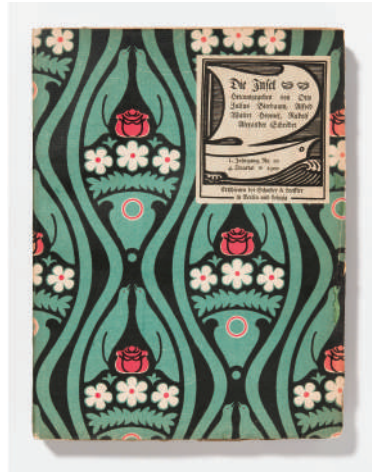
図版2. Die Insel, Juli, nr. 10 (1900) (表紙) 1900年