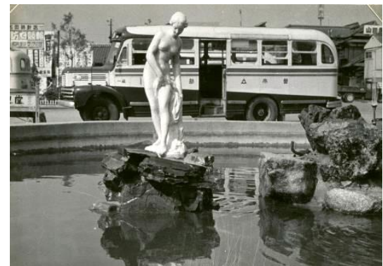
宇部駅(現:宇部新川駅)前に設置された彫刻のレプリカ(当時の様子)