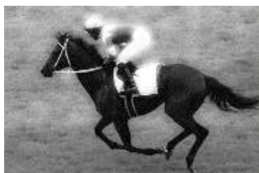
伝説のダービー馬マツミドリ