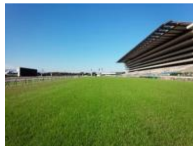
「東京競馬場」競馬の臨場感を楽しめるのはもちろん、お洒落でキレイでサービスも充実していて快適です！