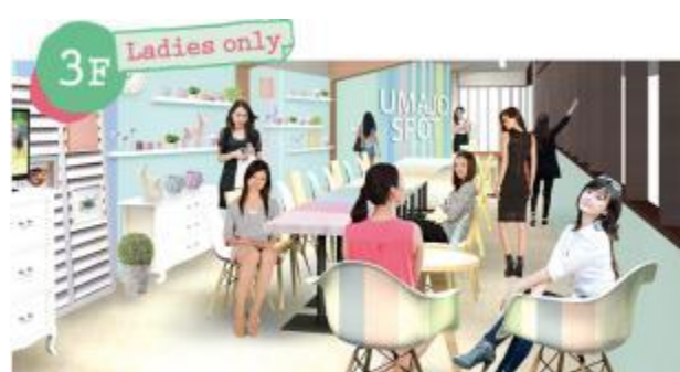
女性のためのリラックススペース「UMAJO SPOT」女性だけで訪れても安心です。