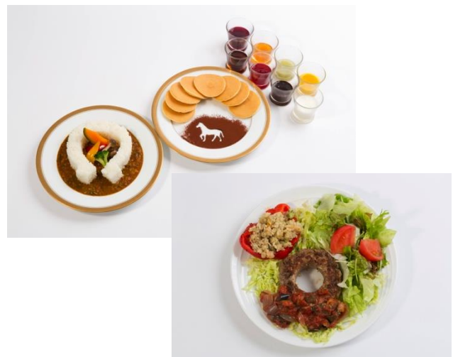
『18食材の馬蹄型ライスカレー』、『ミニホットケーキの8種ソースダービー』(上)と、『大穴ハンバーグと18種類ダービープレート』(下)