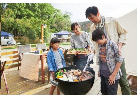
GRAX BBQ イメージ