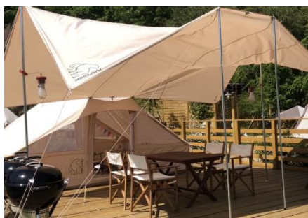
NEW テント「CAMPER'S DORMITORY」

アウトドアでありながら温泉も利用できる利便性の良さが人気で、この6月から新たに自然光が差しこむコットンテント「キャンパーズドミトリー」が加わりました。広々とした室内はマットでゴロ寝ができるので家族やグループでのキャンプに最適です。テント内のファブリックはボタニカルやオリエンタルモダンなど部屋によってテーマが異なり、どのテントになるかは当日のお楽しみのひとつです。