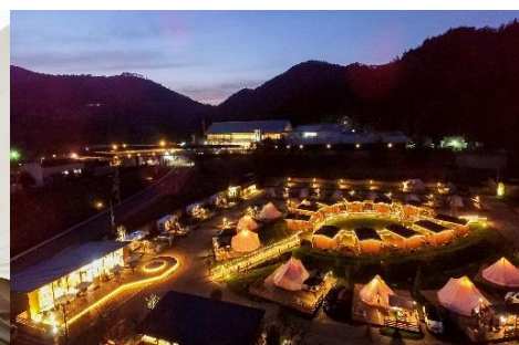
GRAX 夜間全景イメージ