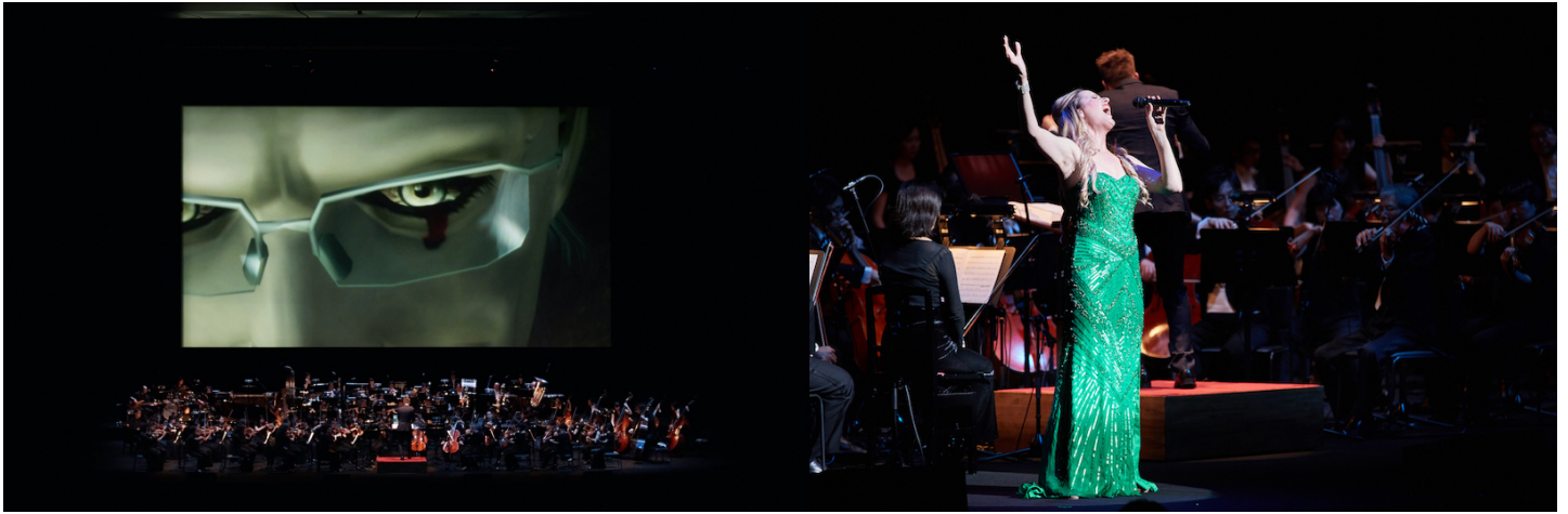
写真：2017年東京公演より