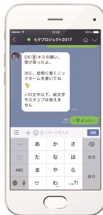
ニックネームの前に合言葉「一宮」を入れる。