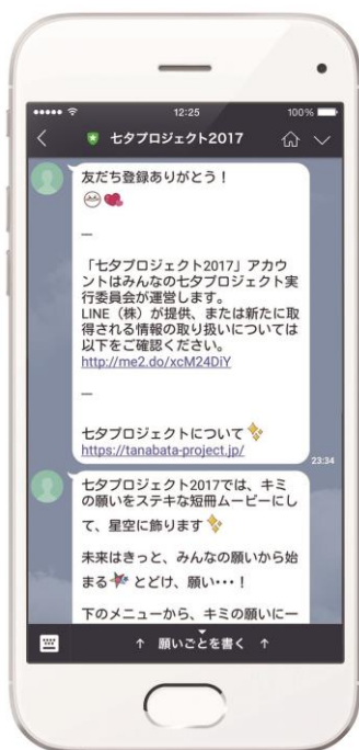
LINE 公式七夕プロジェクトのアカウントを 友だちに追加