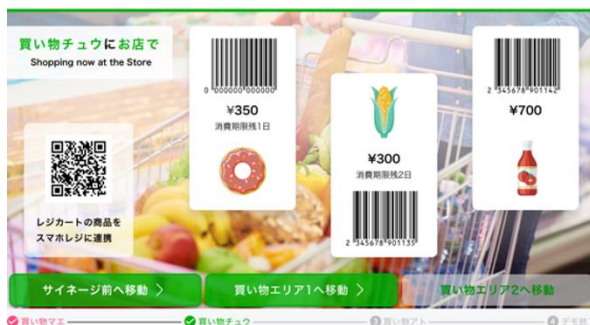
小売店の商品の棚前での購買体験