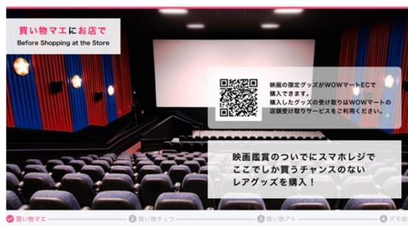
映画鑑賞前後での購買体験 (他事業者と連動)