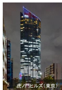
虎ノ門ヒルズ(東京)