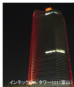
インテックビルタワー111(富山)