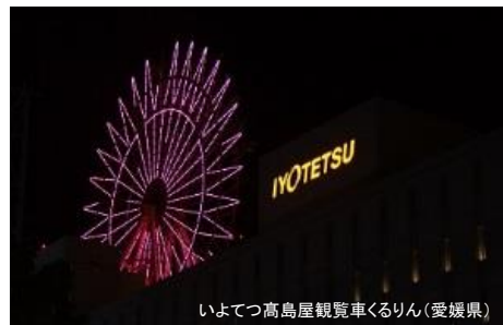
いよてつ高島屋観覧車くるりん(愛媛県)