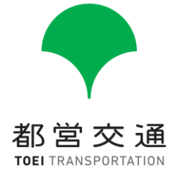
ベーシックロゴ（縦組）