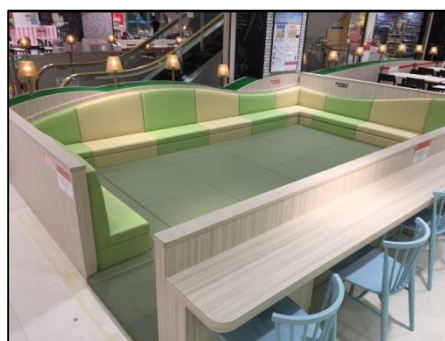
【自由に遊べるキッズプレイスペースをリニューアル】

※この度ご案内しました企画に関しては、予告なく内容や日時が変更になる場合がございます。 ◆今後のイベントや最新情報もご案内させていただきます。ぜひご取材ください。 【お問い合わせ先】広島市西区草津新町2丁目26-1 アルパーク東棟4F 三井不動産商業マネジメント株式会社 担当：橋本・西田 TEL(082)501-1110 FAX(082)501-1200