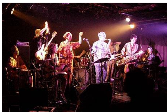
アフロ・ボッサ・クラブ