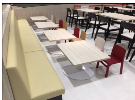
【キッズにぴったりのかわいいテーブル&チェアを新設】