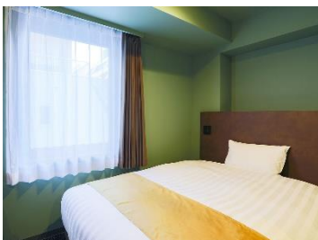
シングル/セミダブル

客室は1名様利用に便利な「シングル」「セミダブル」「ダブル」をメインに、観光にもご利用いただける「ツインルーム」もございます。ふわりと柔らかな寝心地の寝具のほか、全室ナノイー空気清浄機完備、Wi-Fi 接続無料となっています。