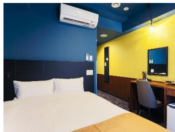
デラックスシングル/ダブル