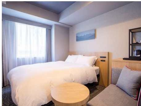
デラックスシングル/ダブルルーム