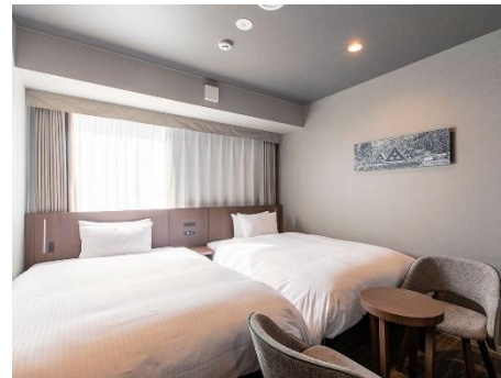
スーペリアツインルーム