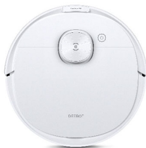
DEEBOT N8 PRO