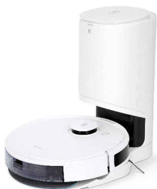
DEEBOT N8 PRO+