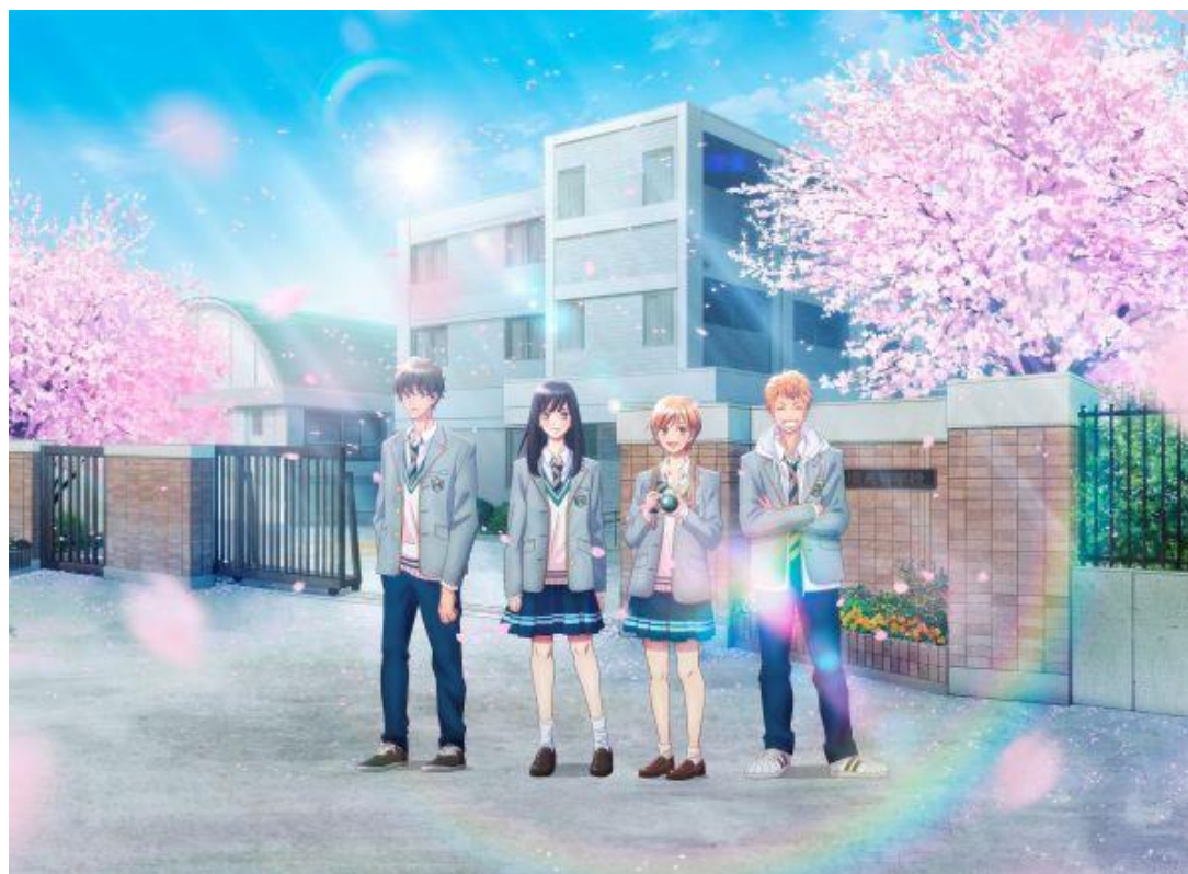
アニメーション動画「レインボーファインダー」最終話「卒業。春を駆け抜けて」より

特設サイトURL： https://www.sej.co.jp/cmp/tokisoba.html